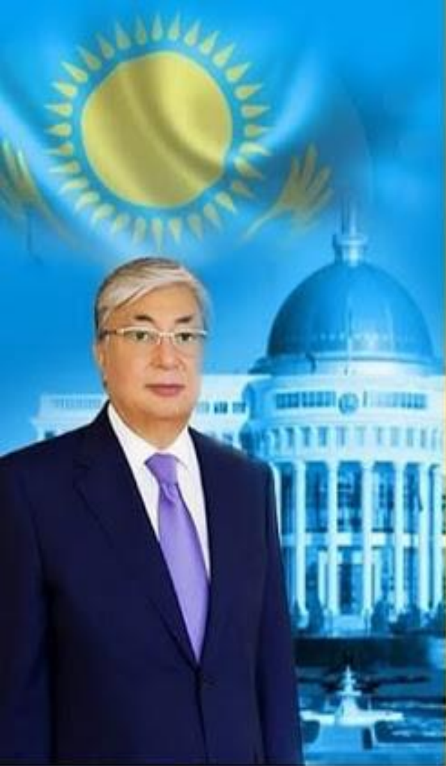
Мемлекет басшысы Қ.ТОҚАЕВ